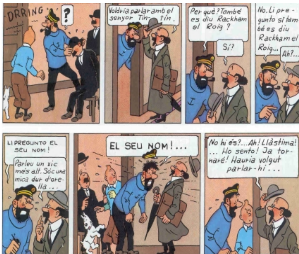
[Hergé: Les aventures de Tintin: El tresor de Rackham el Roig ]