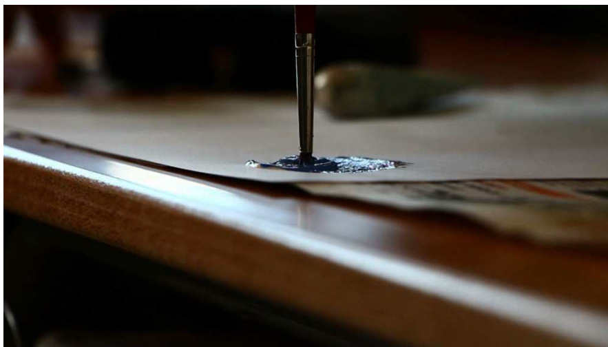
Imagen: Primer plano de un pincel mezclándose en la pintura.

En el caso del vídeo que realizó el grupo de 2º de ESO B, en cambio, una estrategia interesante fue precisamente la de conectar las imágenes de fragmentos de vídeos con el audio de otros fragmentos de vídeos, dando lugar a nuevos relatos y nuevas subjetividades, reinterpretando la realidad del segundo trimestre de proyecto.