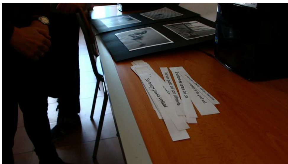
Imagen: Material perteneciente al proyecto que los alumnos realizaron durante el primer trimestre; entre las frases se lee: El tiempo pasa volando / Todos somos iguales, todos somos diferentes / Escuchando los latidos del corazón